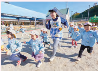
桐之丘幼儿园(关校区内)

关校区内设有桐之丘幼儿园、各务原校区设有ラ・ルーラ(儿童家庭支援中心)。此外,还有常磐保育园、附属幼儿园、岩野田儿童中心等充分的实习环境,可与孩子们近距离地接触。