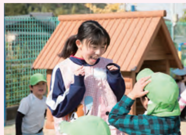
常磐保育园(岐阜市)