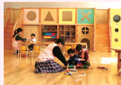
ラ・ルーラ(各务原校区内)