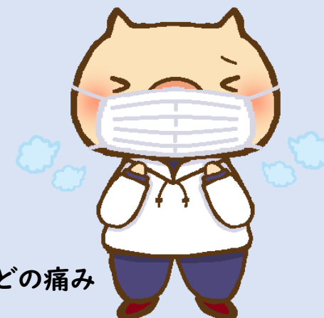
せき・のどの痛み