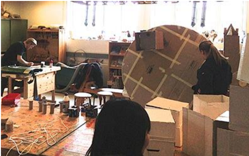
遊具を作るペダゴアの卵たち

ペダゴーはデンマーク語で保育者という意味です。ペダゴー大学は、デンマークの保育者を養成する大学です。今回訪問した大学は、実習に力を入れており、幼稚園・特別支援・薬物依存している子どもの施設などで3回実習を行います。また、併設されている幼稚園では、ペダゴー（保育者）は、子どもたちの遊びに直接介入せず見守ることで、子どもたちが自分たちだけで遊べるようになるのを促す教育を行っています。