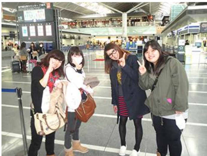
中部国際空港出発前

中部国際空港を出発し、コペンハーゲン空港にてロンドンコースの皆さんと分かれ、デンマークコースは研修先のボーゲンセに向かいました。