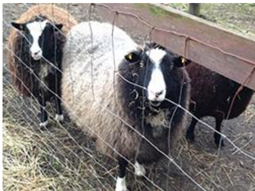
農場幼稚園で飼われている羊たち

キャプテン農場という名前の幼稚園を訪問しました。名前のおり農場を併設した幼稚園で、鶏・豚・羊を飼育し、最後には食肉として食べることで、命の大切さと食の成り立ちを学びます。園児の親御さんとの関係を大切に、食肉として育てた鶏・豚・羊を解体する際は、親御さんと一緒に行い、皆で料理をしていただくそうです。