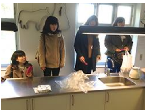
子どもたちも使えるよう工夫されたキッチンです。