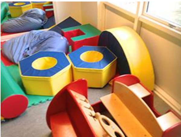
特別支援幼稚園の室内遊具。

特別支援幼稚園は、幼稚園と療育施設が一体となったような施設です。特別支援幼稚園では、子ども一人ひとりの発達の度合いが異なるため、年齢によるクラス分けを行っていません。今回訪問した特別支援幼稚園では、ペダゴギー（保育士）の他、理学・作業療法士もおり、子どもにトレーニングを行うこともあるそうです。また、日本の幼稚園での音楽活動はピアノが主流ですが、デンマークではギターが主流だそうです。