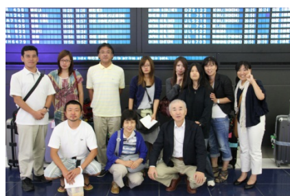
全員無事に帰着しました

以下は最後に残しておきました、8月21日（火）のビーチでの休日の様子です。お読みいただければ、うれしく思います。