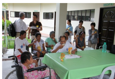
フィリピンの利用者たちと交流