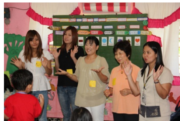
パグアサ・センターで交流