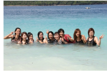
MKD の学生と本学参加者