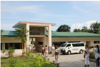
コスギアン老人ホーム

夕方はミンダナオ国際大学の教職員との夕食会が催され、私たちは招待に与りました。このように大学あげて歓迎して下さったことに心から感謝いたします。