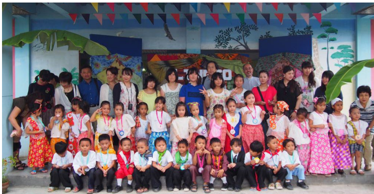
パグアサ・ラーニング・センター訪問